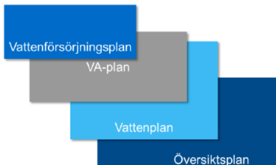
Figur 1. Bilden hämtad från Havs- och vattenmyndighetens vägledning om kommunal VA-planering (rapport 2014:1). Principiell bild som visar hur översiktsplan, vattenplan, VA-plan respektive vattenförsörjningsplan kan förhålla sig till varandra.

Havs- och vattenmyndighetens vägledning innehåller illustrationer för hur olika vattendokument kan förhålla sig till varandra (Figur 1 och Figur 2). Observera att myndigheten ännu inte har någon reviderad vägledning med anledning av lagkravet på Vattentjänstplan från 1 jan 2024.